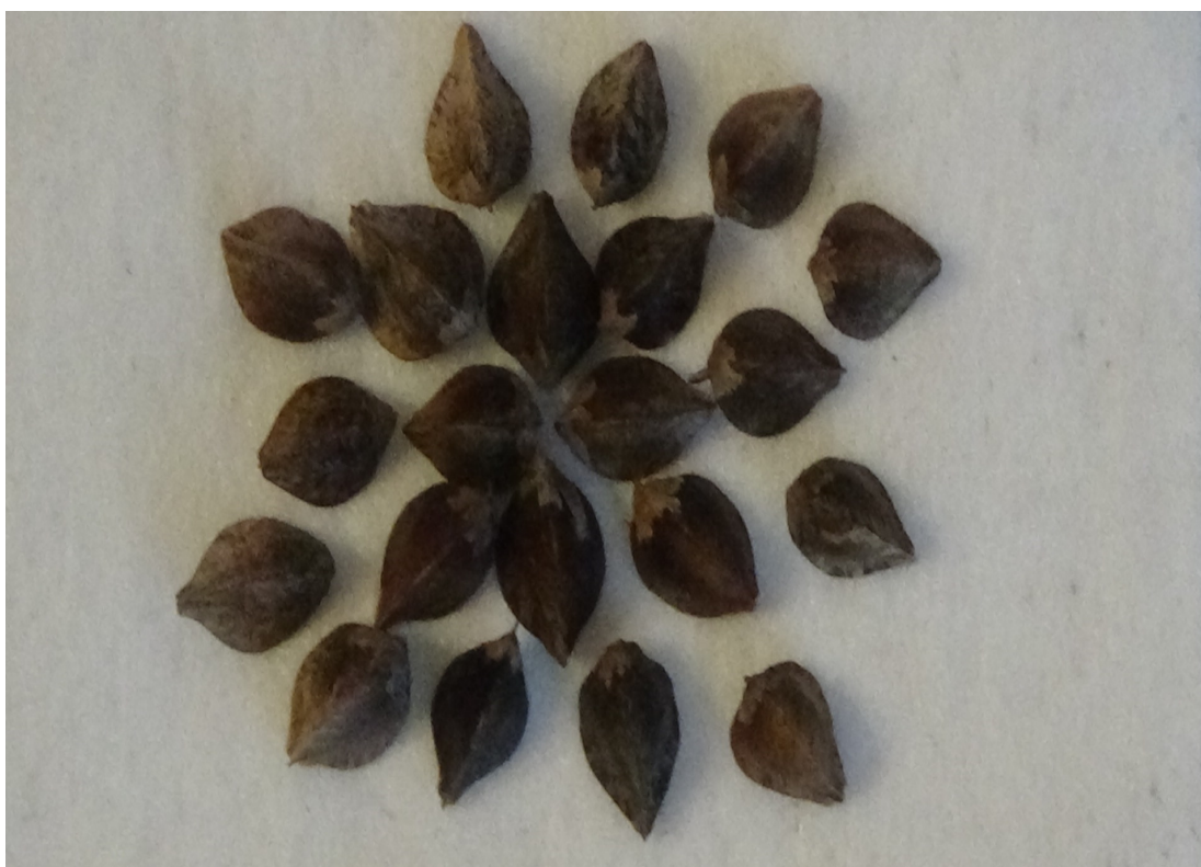
Рисунок семян гречихи